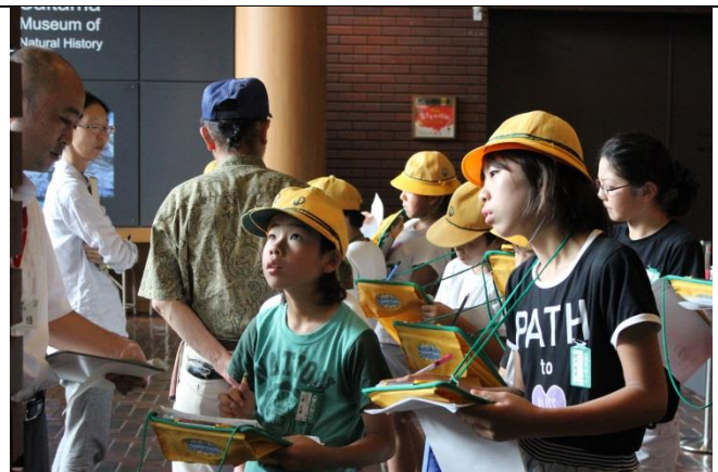
真剣な面持ちで見学しています。