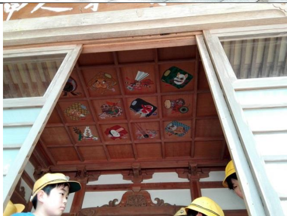
こんなところにも絵が！