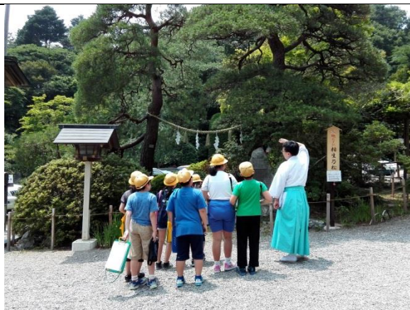
宝登山神社にやってきました。