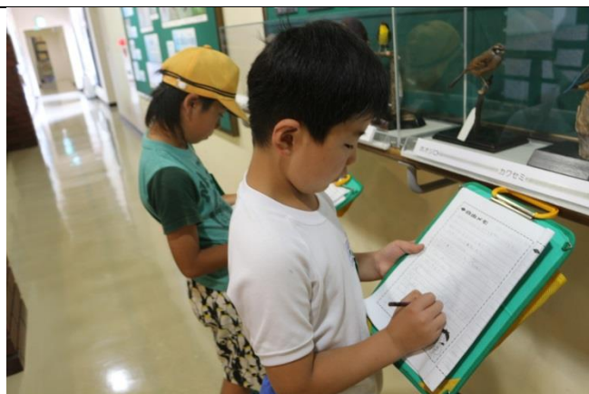
メモもしっかりとります。