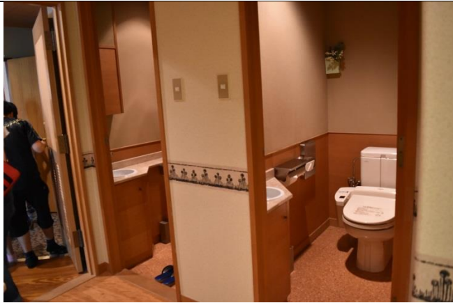
お手洗いが二つもついています。