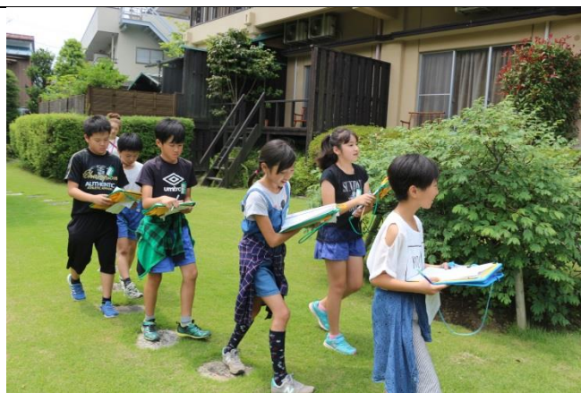
広いお庭の散策もさせていただきました。