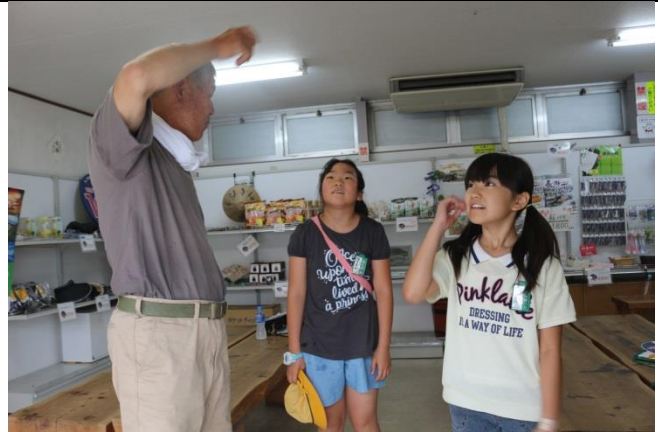
長瀬ライン下り案内所。上に長瀬の由緒ある場所の写真が並んでいます。