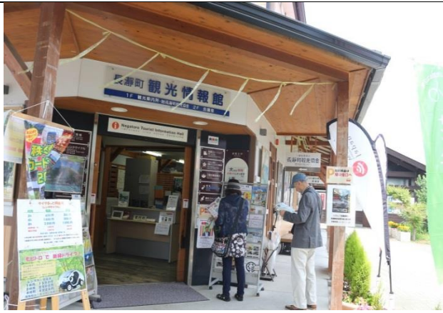
長瀬町観光案内所 船玉祭について質問をしに行きました。