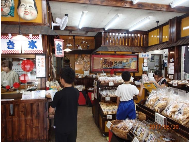
まるぶつにきました。

6月29日（木）、保護者ボランティアの皆様のご協力により、総合的な学習の現地学習をしてきました。子供たちの質問に対して、FAXでの返答をいただいたお店もありました。お忙しい中、地域の皆様、ご協力ありがとうございました。現地から帰って、子供たちの顔が満足そうに輝いていました。やはり、課題を持って、その場で見て聞く学習は、何より勝ると感じた瞬間でした。