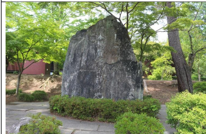
長瀬は地質学を勉強するには最適の場所。宮沢賢治も長瀬を訪れています。