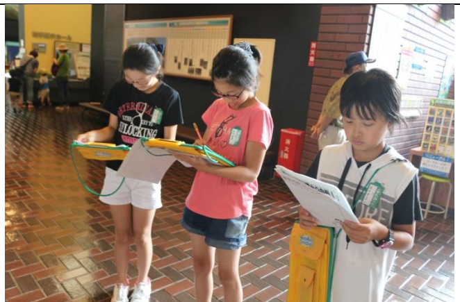
自然の博物館にやってきました。