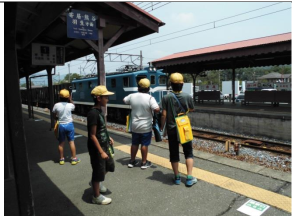
ちょうど、貨物列車がやってきました。 車両を数えます。