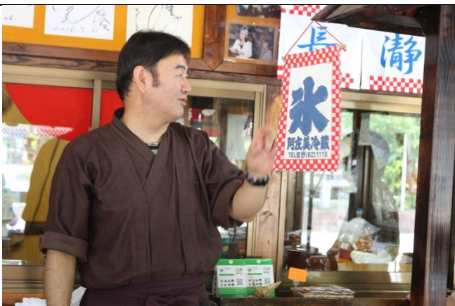
阿左美冷蔵の氷を使っているお店には、このれんがかかっているそうです。