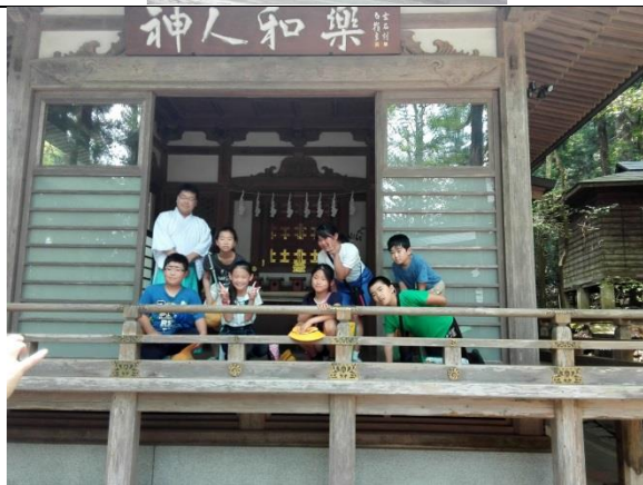
神殿に上げていただきました。