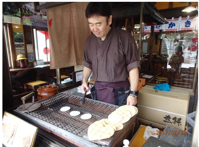
いろいろな形・大きさのおせんべいがあります。