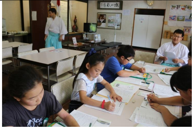
宝登山神社の由来は・・・