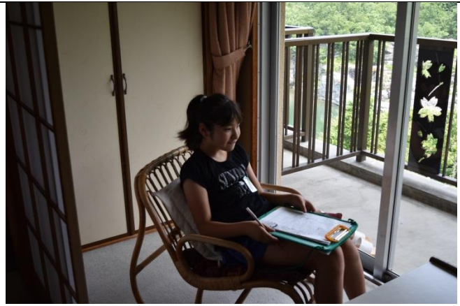
岩畳を望めるこの景色も最高。