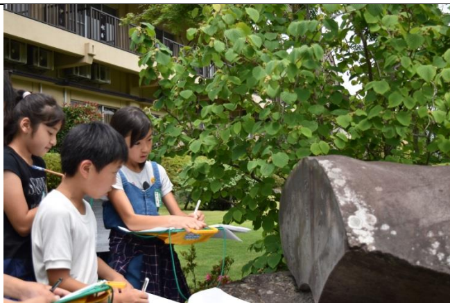
有名歌人の歌碑が残されています。