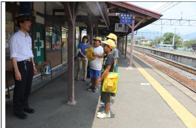
班長が自分の言葉でお礼を言っています。