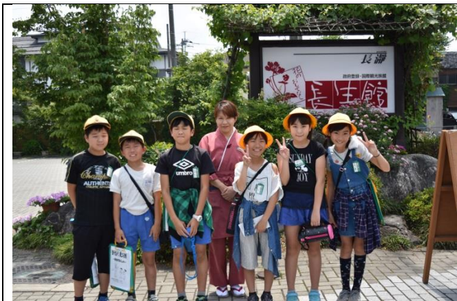
たくさん見学させていただき、本当に満足の日でした。