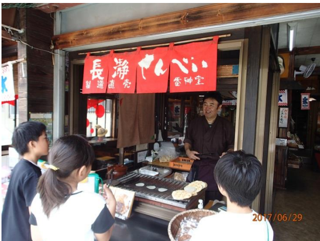
特別に焼いているのを見せていただきました。