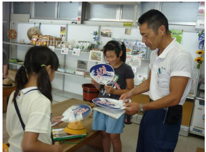
特別にうちわもいただきました。