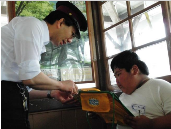
これはどうなっているのですか？