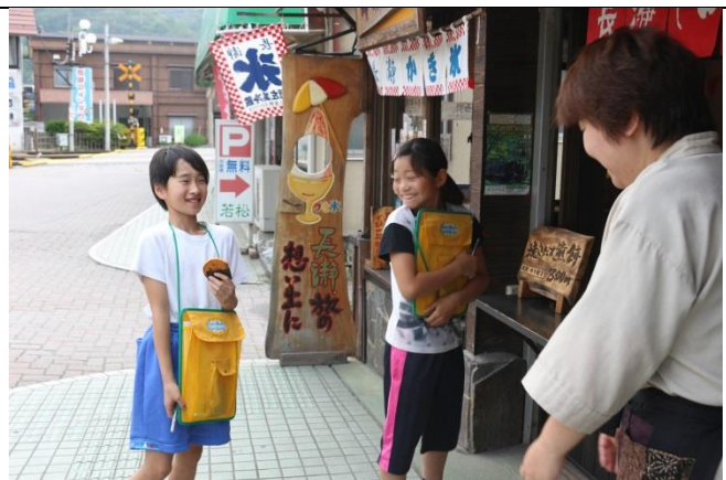
山草の話題になりました。