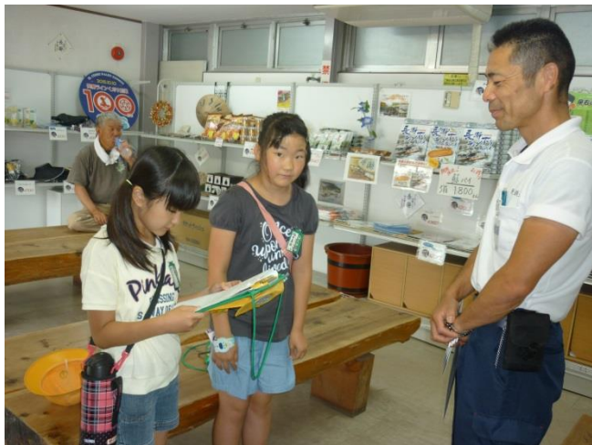
二人でも、たくさんの質問を出しました。