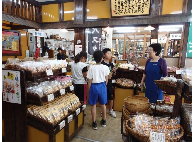
商店街のことについて質問しにきました。