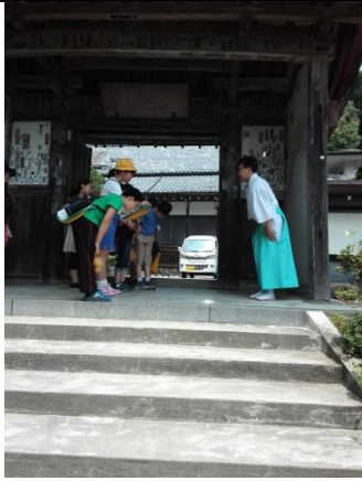
しっかりお礼を言えました。