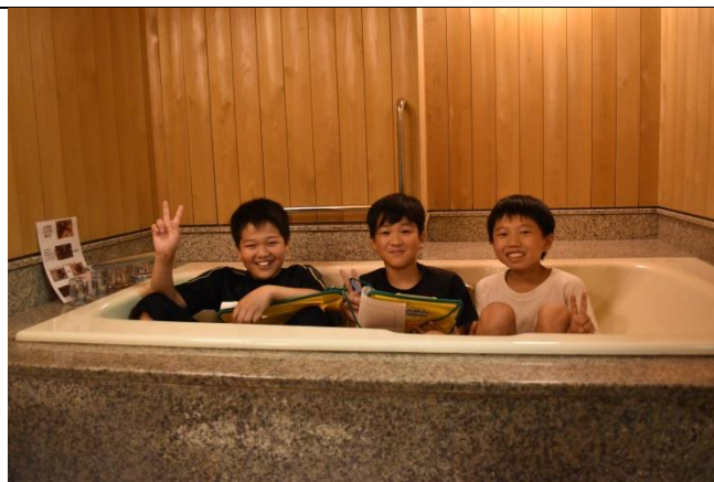
3人が一緒に入れるこの広さ。