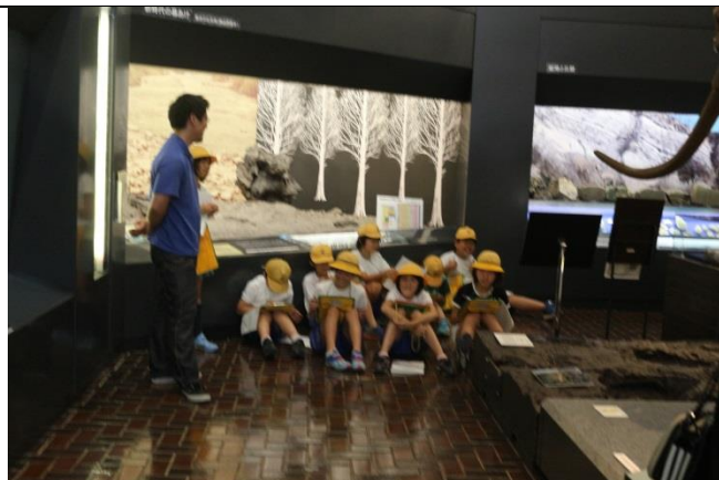
質問分野に分かれて、グループで話を聞きます。