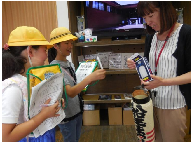
これは、どうやって使えますか。